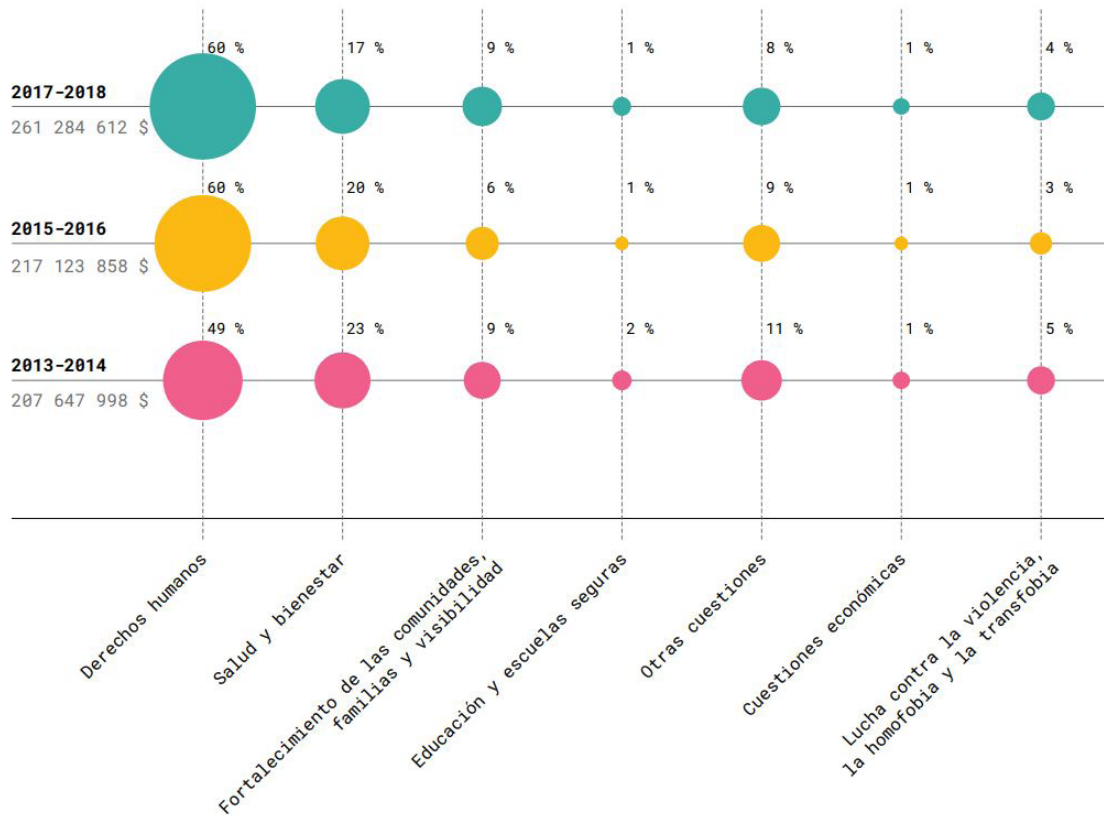
DISTRIBUCIÓN DE LA FINANCIACIÓN GLOBAL LGBTI+, POR TEMA TRATADO (2015-2018), Fuente de la ilustración: Informe de Recursos Globales (2017/2018), p.38